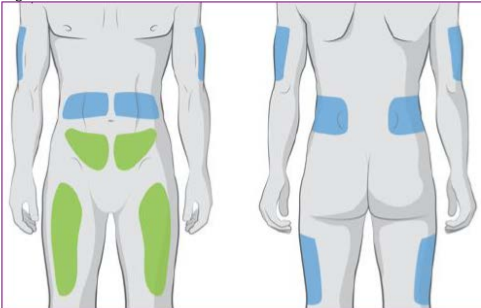
Figuur: SCIG infusie locaties

Groene locaties hebben de voorkeur als infuuslocatie; alternatieve locaties zijn in blauw